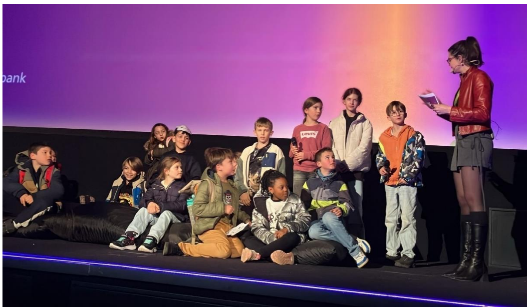
Sur scène lors de l'interview.

Nous n'avons pas gagné, mais nous rentrons heureux de l'expérience vécue.